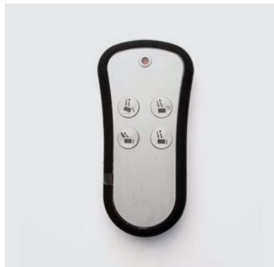
PU1 Pulsantiera Blackberry wireless 4 tasti per poltrona alzapersona 2 motori o 3 motori con meccanica rinforzata 200 kg.