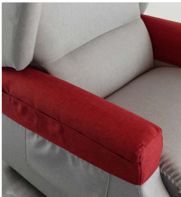
COPRIBRACCIOLI Coppia di copribraccioli a protezione degli stessi, completi di tasche porta oggetti.