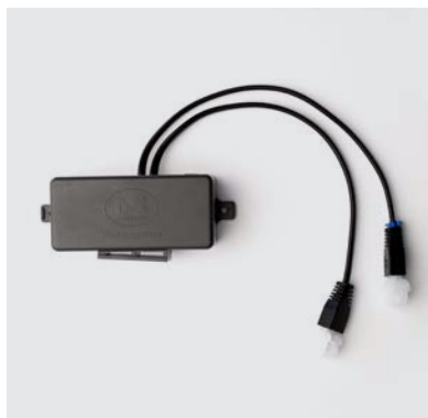
CE1 Centralina wireless sistema elettrico Motion per poltrona alzapersona con 2 motori.