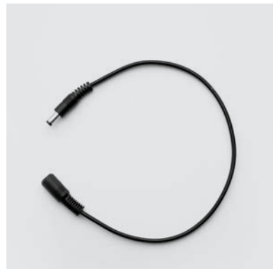
CA3 Cavi corti 20/30/40 centimetri a bassa tensione per eventuali collegamenti fra le componenti del sistema elettrico meccanismo Motion.