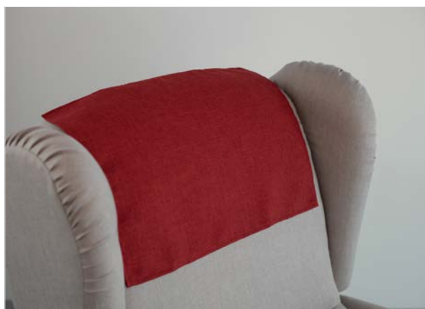
STUOIA COPRITESTA Stuoia in tessuto che protegge la parte superiore dello schienale.