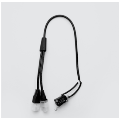
CA5 Connettore con micro per disattivazione motore di sollevamento in caso di utilizzo del carrello ruote delle poltrone.