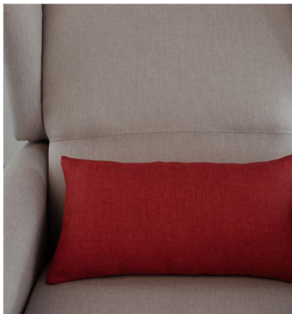
CUSCINO LOMBARE IN BUBBLE Morbido imbottito in piuma sintetica.