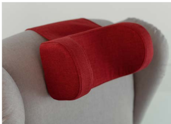
CUSCINO POGGIATESTA CONTENITIVO Imbottito in gomma con sagomature laterali contenitive.