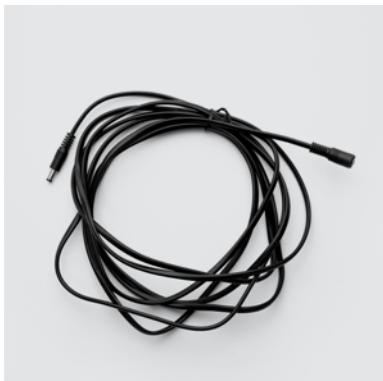
CA2 Cavo lungo a bassa tensione che collega il trasformatore codice TRA1 alle poltrone con sistema elettrico per meccanismi Motion.