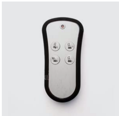
PU1 Pulsantiera Blackberry wireless 4 tasti per poltrona alzapersona 2 motori o 3 motori con meccanica rinforzata 200 kg.