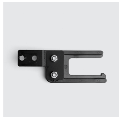
SU1 Supporto in acciaio-plastica per posizionare e fissare le centraline e la batteria al litio alla struttura delle poltrone relax con meccanismo Motion.