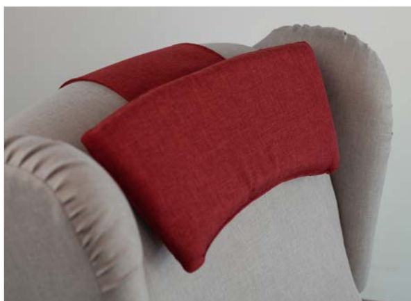
CUSCINO POGGIA TESTA SAGOMATO Imbottito in gomma.