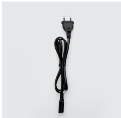
CA1 Cavo di collegamento del trasformatore alla rete elettrica domestica, compatibile con i trasformatori aventi codice TRA1 e TRA2.