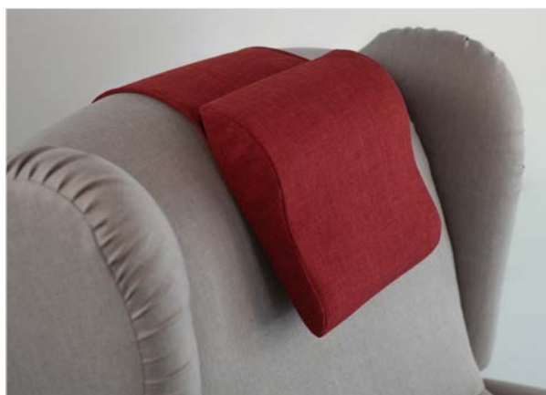
CUSCINO POGGIA TESTA SNOOPY Ergonomico imbottito in gomma sagomata.