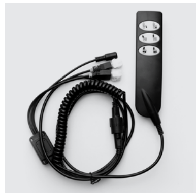
PU5 Pulsantiera con filo a 3 tasti per poltrone relax Motion a 2 motori, il terzo tasto permette di chiudere il poggia piedi e di sollevare lo schienale della poltrona contemporaneamente.