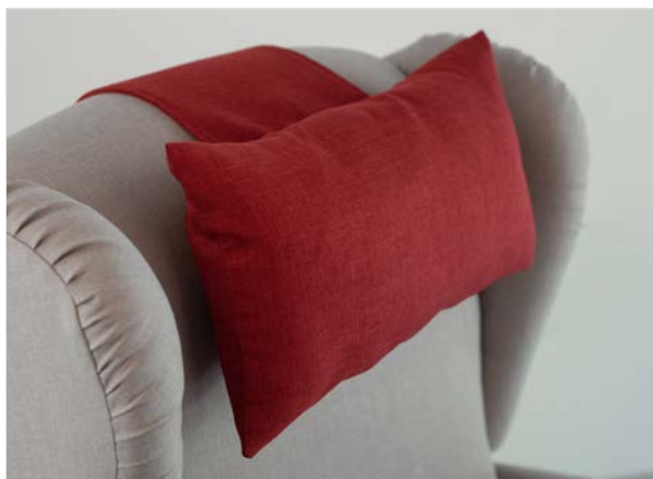
CUSCINO POGGIATESTA IN BUBBLE Imbottito in piuma sintetica.