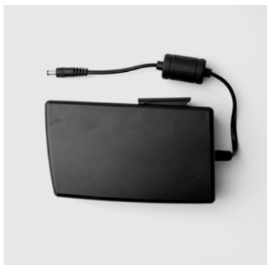
BA1 Batteria al litio per il funzionamento delle poltrone relax scollegate dalla rete elettrica domestica.