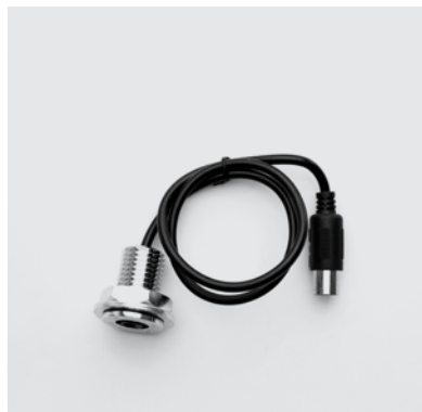
CA4 Connettore cablato per alimentazione e ricarica batteria al litio sistema elettrico Motion.