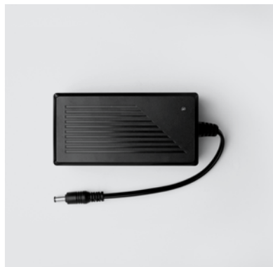
TRA1 Trasformatore per sistema elettrico Motion.