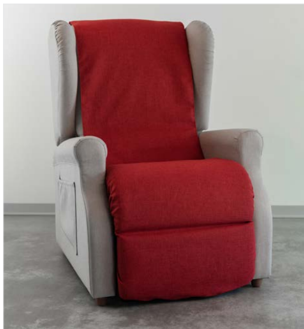
STUOIA COPRIPOLTRONA Stuoia in tessuto che protegge la seduta e lo schienale della poltrona.