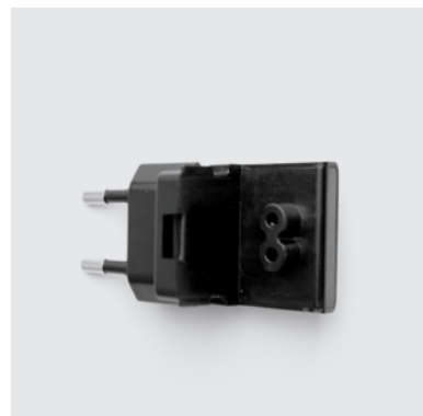
PR1 Presa a muro per trasformatore elettrico sistema Motion, solo su nuovi trasformatori.