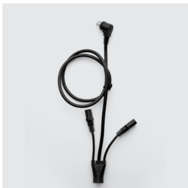
CA6 Cablaggio di collegamento pulsantiera e motori meccanismo Stawett movimento alzapersona a 4 motori.