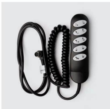
PU6 Pulsantiera con filo a 5 tasti per poltrona alzapersona a 4 motori meccanismo Stawett.