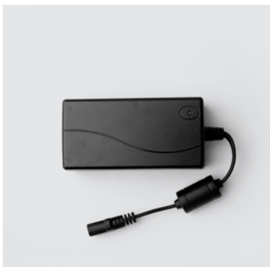
TRA2 Trasformatore punto linea per sistema elettrico Stawett.